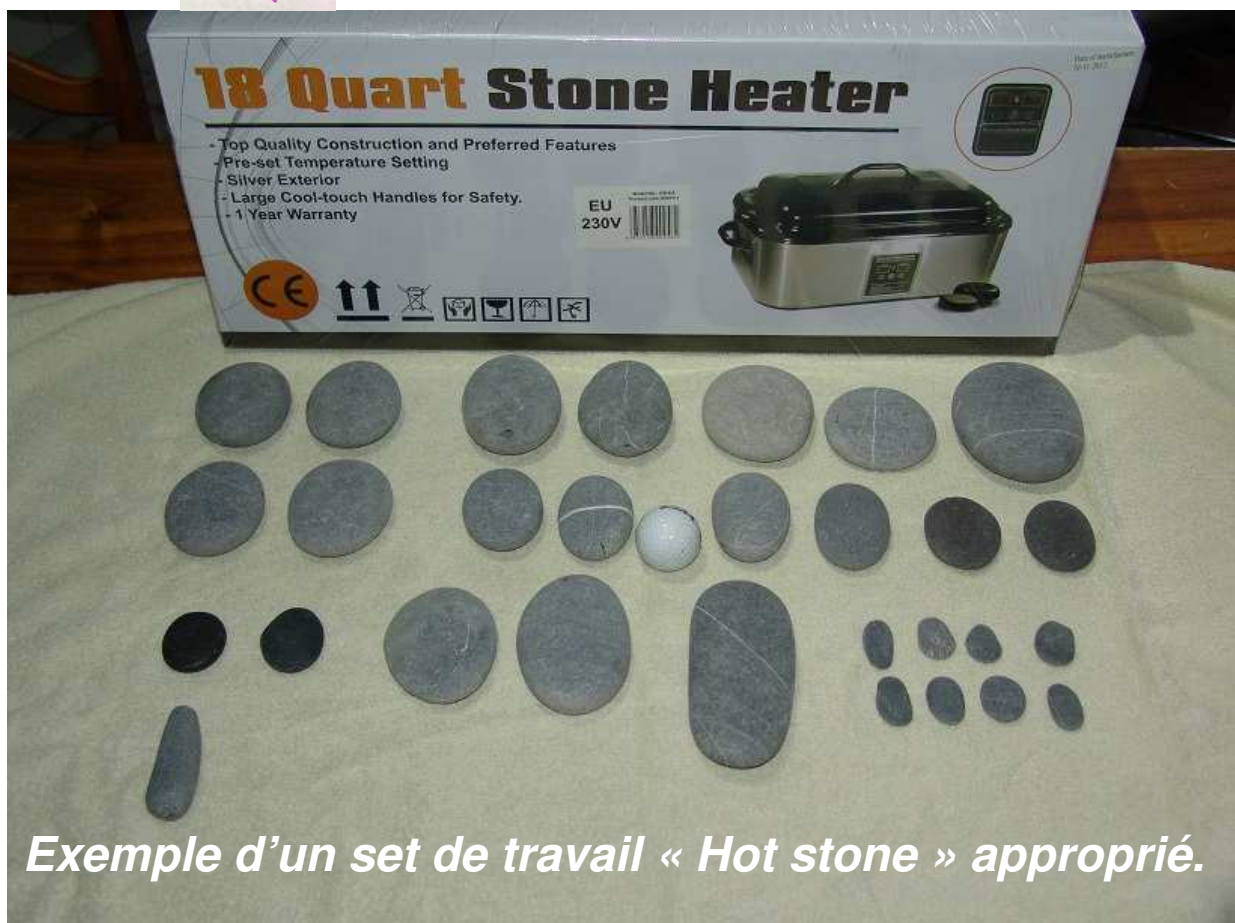
Exemple d'un set de travail « Hot stone » approprié.